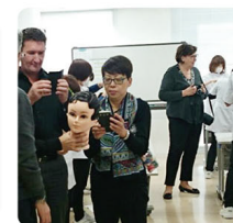
IPSN理事達による認定校視察の様子：日本

エステティック部門に引き続き、昨年3月から続けてきたヘア部門でのマッピング作業が終わり、2014年12月に日本でIPSN理事達による認証審査が行われました。