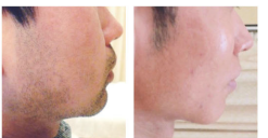
エステティック効果発表会(脱毛部門)