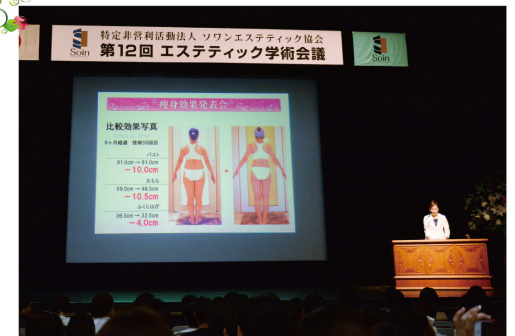
エステティック効果発表会(瘦身部門)