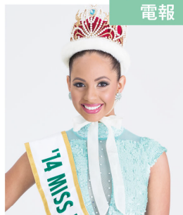
ミス・インターナショナル2014 ハレリー・ヘルナンデス (プエルトリコ)

第12回エステティック学術会議の開催おめでとうございます。昨年、私はミス・インターナショナル2014で日本に3週間滞在しました。日本人の持つ外面と内面の両方の美意識の高さに驚かされました。来日した際に、おもてなしについて説明をうけました。正直おもてなしの意味は理解できませんでしたが、帰国前の3日間、おもてなしの心を理解することができました。細かな気遣い、姿勢、笑顔、お辞儀、すべてがおもてなしであり、それはゲストを温かく迎え入れ、居心地をよくするものでした。日本滞在中、日本の美、日本の美容業界で働く方たちをもっと知る時間があれば、と心から思いました。日本の美に対する技術は高く、本日に参加されています皆様には世界に羽ばたいていていただきたいと思っております。