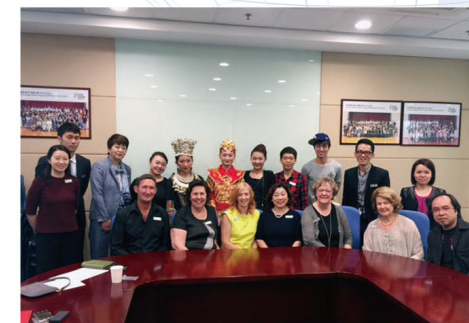
香港での理事会及び年次総会にて

また、2014年9月にはニュージーランドで理事会に、2015年3月には香港で理事会及び年次総会に参加いたしました。