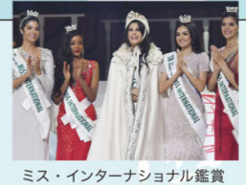
ミス・インターナショナル鑑賞