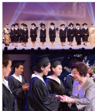
国際ビューティセラピスト 合格者表彰式の様子

今年も盛りだくさんの内容で学術会議が終了し、様々な観点から「美とは何か？」について考え、多くの学びを得られた一日となりました。