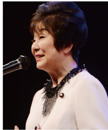
参議院 議員 山東 昭子 様

人は誰もいつになっても美しくありたいと願いますが、ある時期になると「もう私もいつだから」「もういいわ」と言っている人たちがおられます。