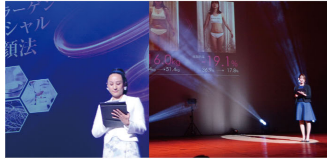
プログラムの最後は、2018 スパ・ウェルネス大賞 優秀技術賞 受賞サロンによる「効果発表会」が行われ、ボディ・フェイシャル・脱毛について、それぞれ驚きの効果が紹介されました。