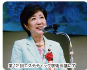
小池 百合子氏 自由民主党 広報本部長 衆議院議員

全国からご参会の若さあふれる皆様 方が、より一層見識を深められる素晴 らしい機会となりますことを期待申し 上げます。