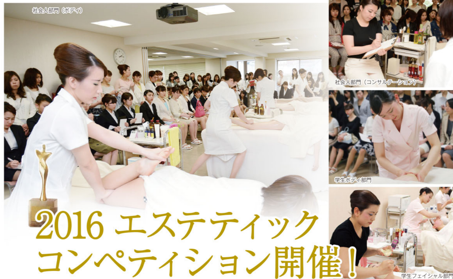
社会人部門 (ボディ)