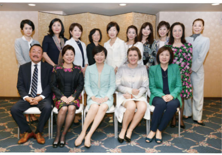
学術会議記念撮影： 内閣総理大臣令夫人安倍 昭恵氏 / ツヴェトコピッチ 駐日マケドニア共和国大使と