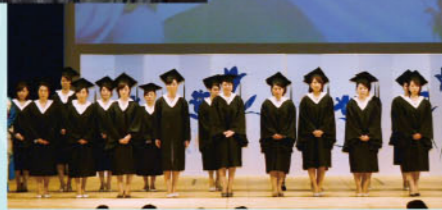
インターナショナルビューティセラピスト 合格者表彰式の様子