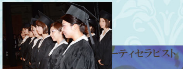
ビューティセラピスト