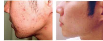
エステティック効果発表会(フェイシャル部門)

2015年度にお客様に最も素晴らし い効果を出したサロンに贈られるエステ ティック大賞優秀技術賞の表彰式が行わ れ、受賞サロンによる「エステティック 効果発表会」が行われました。ボディ、 フェイシャル、脱毛各部門の素晴らしい 効果が発表されるたびに驚きの声があ る中、響き渡りました。