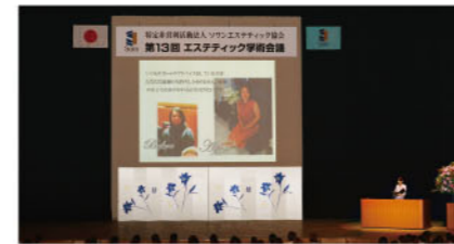
エステティック効果発表会(ボディ部門)