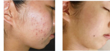
効果発表会(フェイシャル部門)

2016年度にお客様に最も素晴らしい効果を出したサロンに贈られるSPA・ウェルネス大賞優秀技術賞の表彰式が行われ、受賞サロンによる「SPA・ウェルネス効果発表会」が行われました。ボディ、フェイシャル、脱毛各部門の素晴らしい効果が発表されるたびに驚きの声が会場中に響き渡りました。