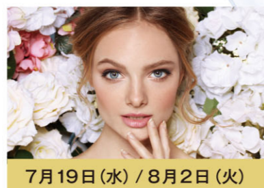
7月19日(水) / 8月2日(火)