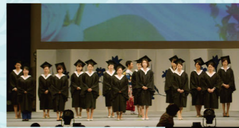
▲国際ビューティセラピスト資格者表彰式の様子