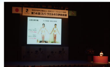
効果発表会(ボディ部門)