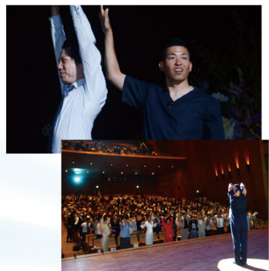
講演「一生「疲れない」姿勢と印象の作り方」。実際身体を動かし姿勢を矯正していくことで、効果を体感することができた講演となりました。