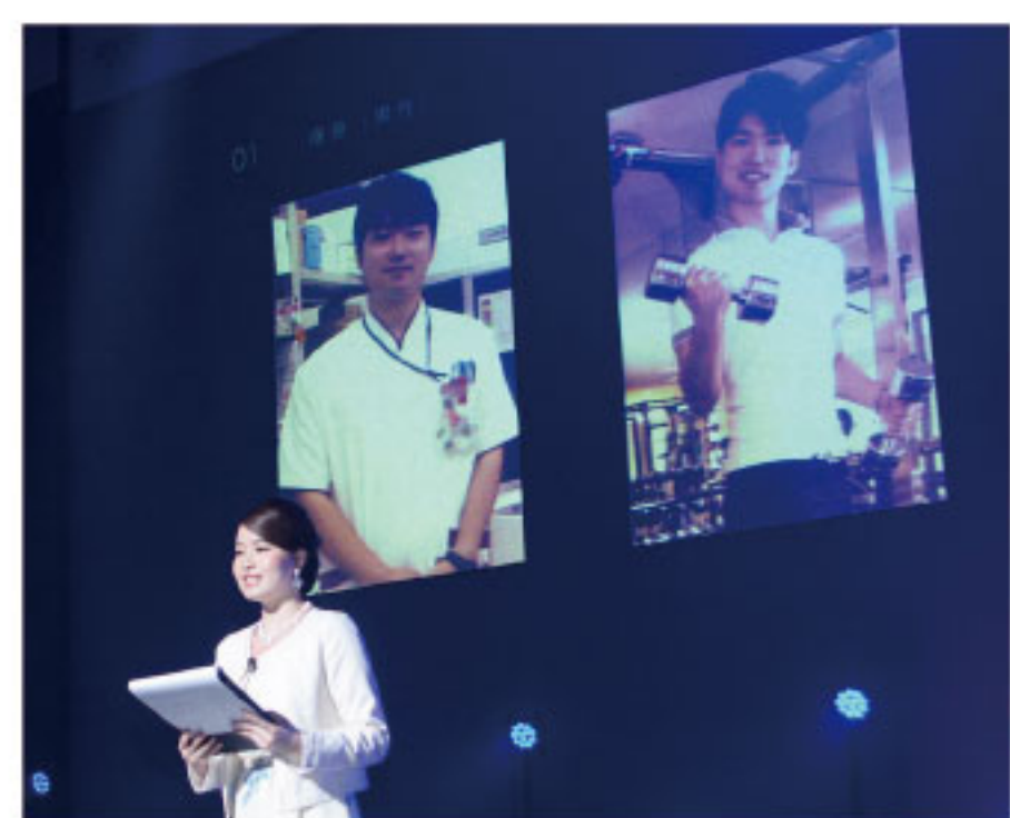
「スパ・ウエルネス効果発表会」の様子。ボディ、フェイシャル、脱毛各部門の素晴らしい効果が発表されるたびに驚きの声が会場中に響き渡りました。