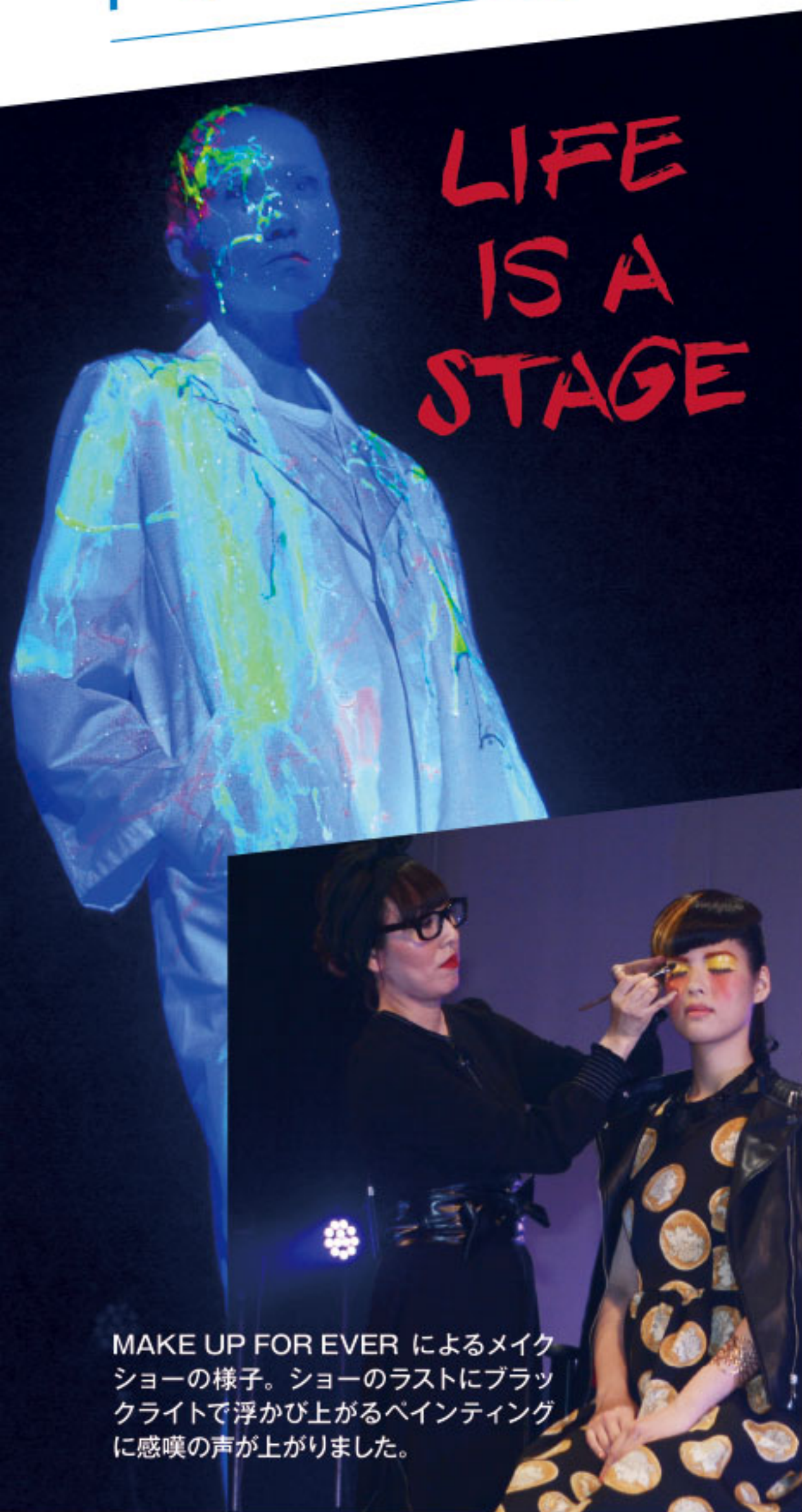
MAKE UP FOR EVER によるメイクショーの様子。ショーのラストにブラックライトで浮かび上がるペインティングに感嘆の声が上がりました。