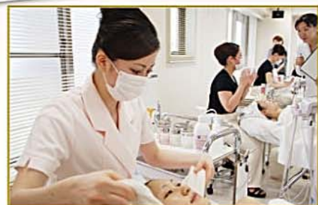
学生フェイシャル部門