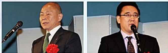
来賓としてご参加いただいた第90代内閣総理大臣 安倍 晋三氏(写真右) 経済産業省商務情報政策局サービス政策課 課長 前田 泰宏氏(写真中)