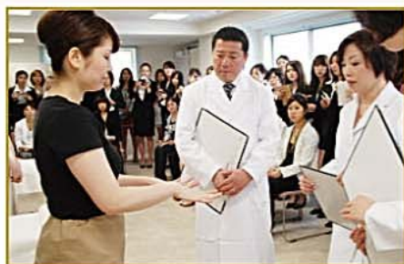
身だしなみチェック