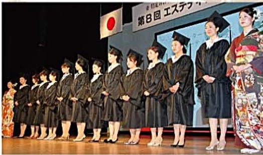
2010 年度資格試験合格者表彰式 エステティシャンの最上級資格 認定インターナショナルビューティセラピスト合格者連

今年も様々な知識と資格をもった レベルの高いエステティシャンが 輩出されました。