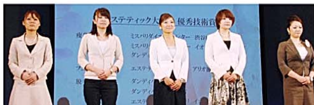
エステティック大賞表彰の様子