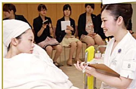
コンサルテーション(分析)で個人に合ったトリートメントを選ぶ